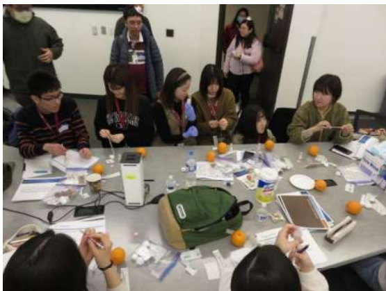
図1. 予防接種練習の様子

日本と違って、アメリカでは薬剤師が予防接種を行うことができます。薬剤師が予防接種を行えることは、コロナパンデミックの影響により全米で知られるようになりました。ワクチンの接種は日本においては、病院で医師や看護師が行うものですが、米国においては薬剤師が薬局で行うことができます。今回の研修では予防接種の練習としてオレンジに生理食塩水を打ちましたが、実際に人にワクチン投与をすることを考えると、相当の練習とそれに伴う責任が必要だと思いました。また、日本でもアメリカと同様に薬局で薬剤師がワクチン投与を行うことができれば、病院に行く必要もなく、コロナパンデミックの時のような人手不足が起きることはなかったと思うので、取り入れたほうが良いと思いました。