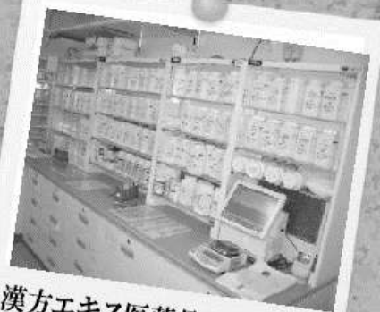
漢方エキス医薬品使用量No.1