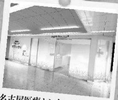
名古屋医療センターの門前薬局