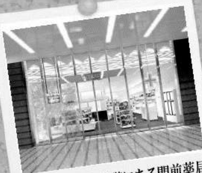
JRゲートタワー15階にある門前薬局