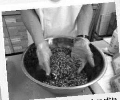
きざみの生薬も てんこ盛り