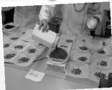
処方箋に基づく漢方調剤薬局