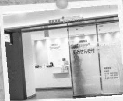
栄クリスタル広場前の面薬局